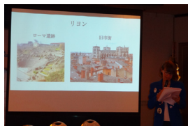
プトゥ・ギャハンス(茜)さんの プレゼンテーション