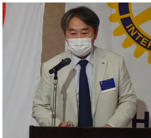
会長挨拶がおこなわれました。